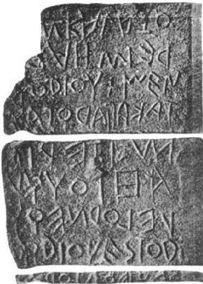
قدیمی‌ترین سنگ‌نوشته شناخته‌شده به زبان لاتین